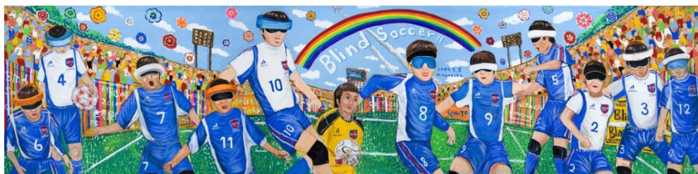
ブラインドサッカー協会