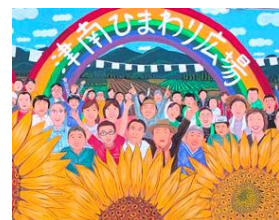
ひまわり畑 大地の芸術祭